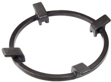
Porta Wok in Ghisa